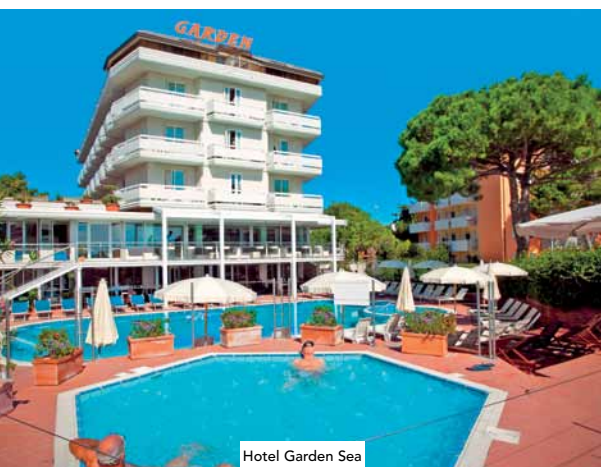
Hotel Garden Sea