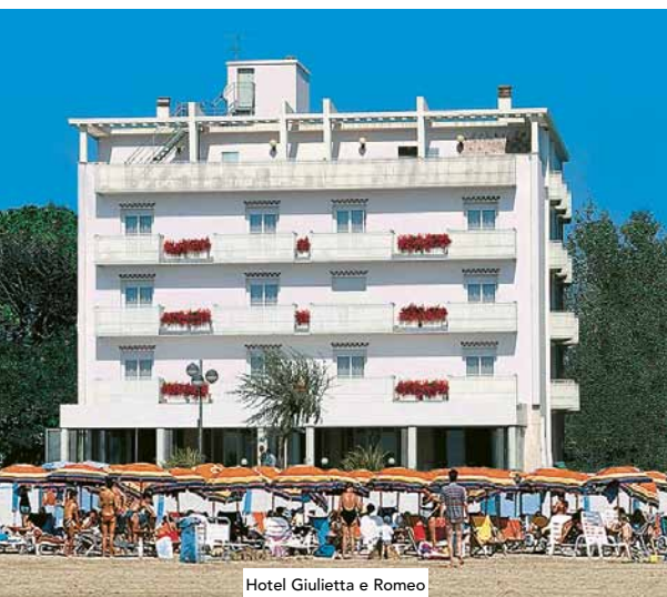
Hotel Giulietta e Romeo