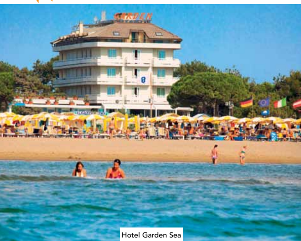
Hotel Garden Sea