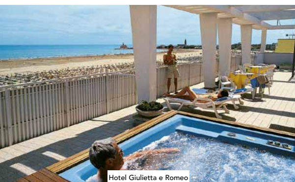
Hotel Giulietta e Romeo