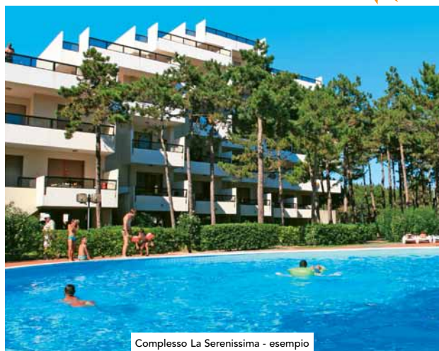
Complesto La Serenissima - esempio

Soggiorno con angolo cottura e divano letto doppio, zona notte con camera matrimoniale, camera a 2 letti, doccia/wc, balcone.