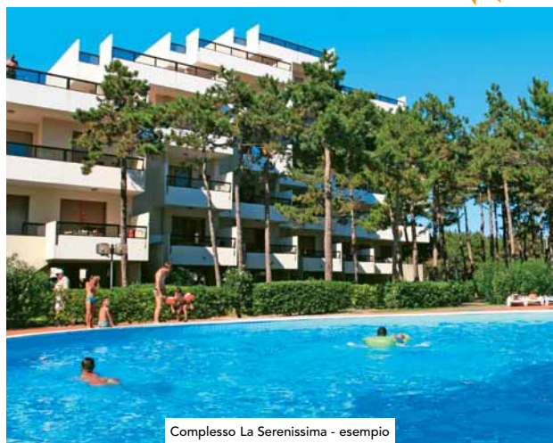
Complesso La Serenissima - esempio

Prenota presto: 5% di sconto per prenotazioni confermate entro il 31/3